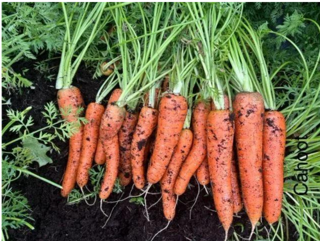
Bilde av Cahoot, Smøla 2024.