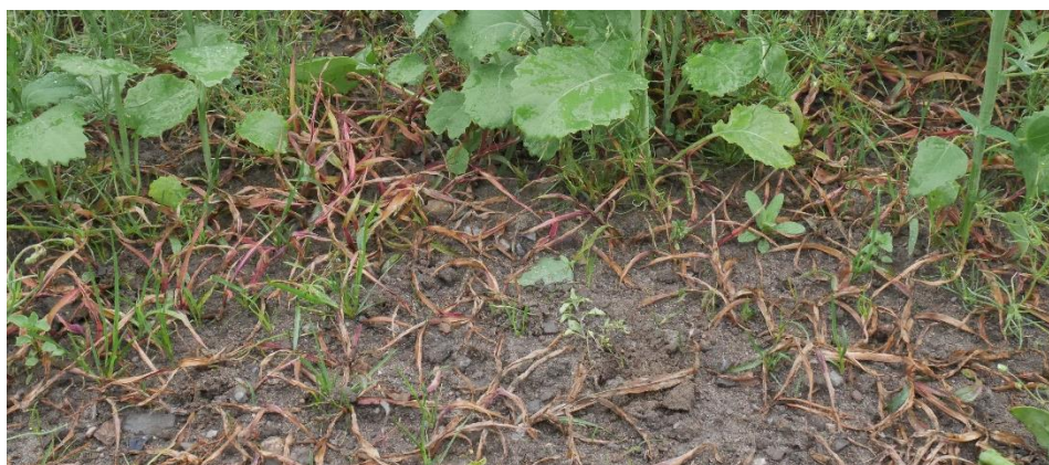
Hønsehirse kan bekjempes!

Foruten Forskningsmidlene for jordbruk og matindustri (Fondet for forskningsavgift på landbruksprodukter-FFL og Forskningsmidler over jordbruksavtalen - JA), finansieres prosjektet av følgende (i alfabetisk rekkefølge): Bayer AS, Felleskjøpet Agri SA, Fylkesmannen i Buskerud, Fylkesmannen i Oslo og Akershus, Fylkesmannen i Telemark, Fylkesmannen i Vestfold, Fylkesmannen i Østfold, Norgro AS og Strand Unikorn AS.